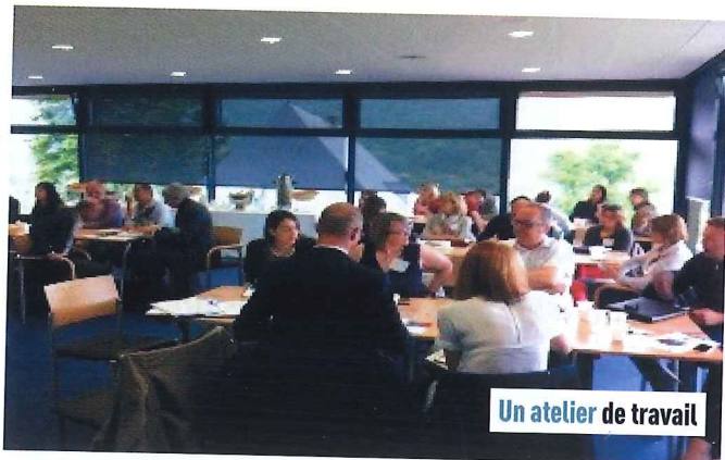
Un atelier de travail

« Nous organisons les Mase Awards où les entreprises peuvent candidater en envoyant un dossier sur leurs bonnes pratiques. »